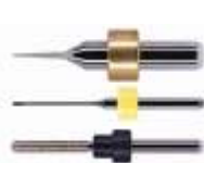
Фрезы для станков