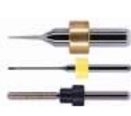
Фрезы для станков